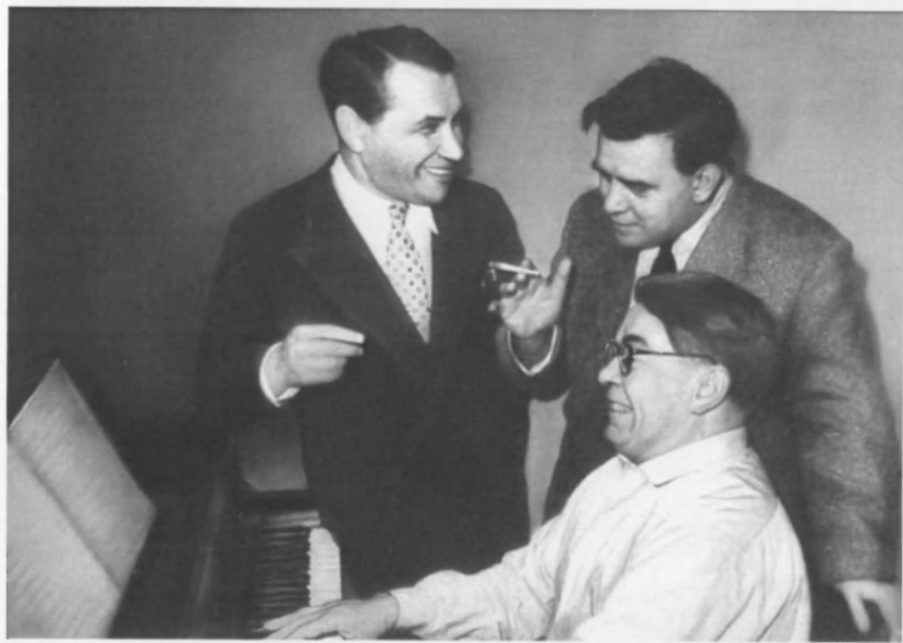
С Марком Бернесом и Виктором Кнушевицким. 1950-е гг.