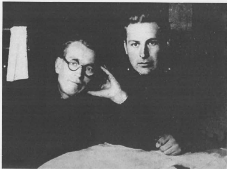
С Алексеем Фатьяновым. 1942 г.