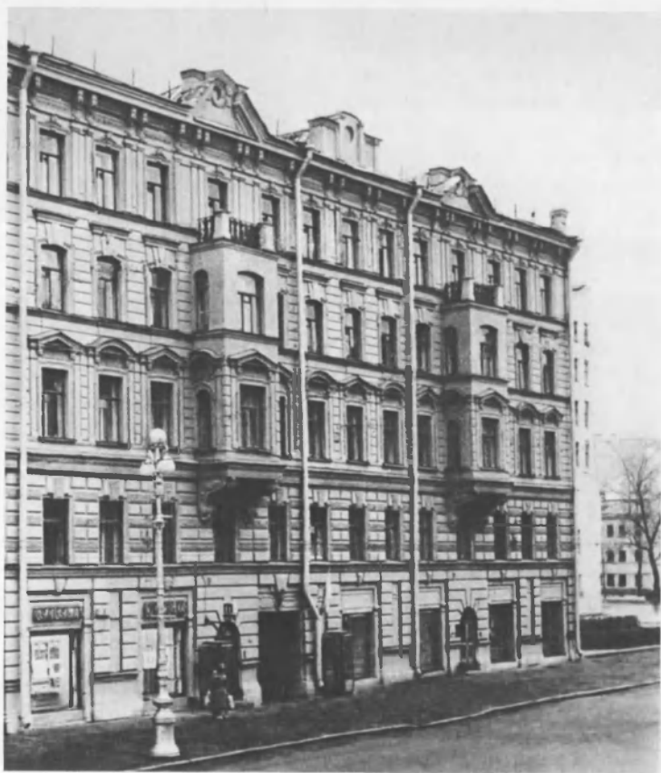
Дом № 139 на Невском проспекте, где вырос В. П. Соловьев-Седой