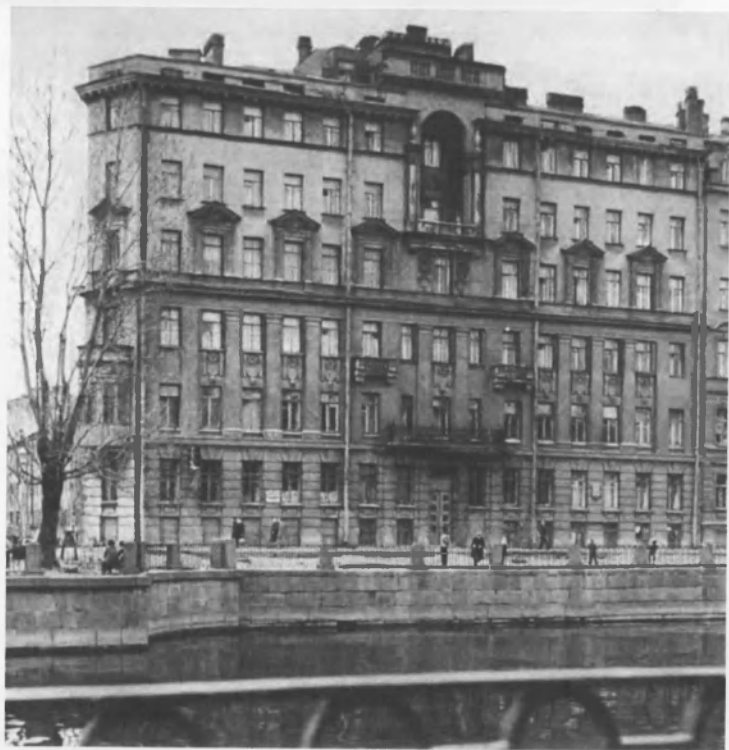
Дом № 131 на набережной Фонтанки, в котором с 1950 по 1979 г. жил В. П. Соловьев-Седой