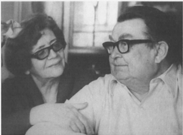
С женой. Начало 1970-х гг.